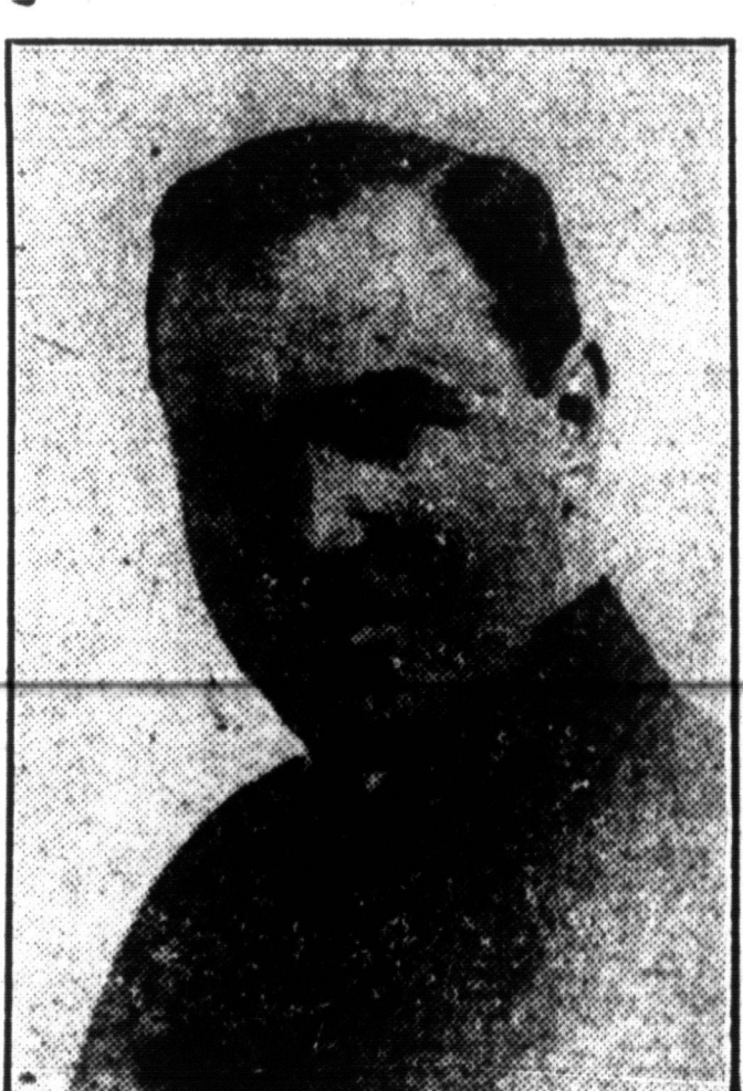
ווימששרין, דער שלמער יוניאן־פיה־ רער, און דער גשנצער משכער פון דער פיקעש־קאָמישע.

ביים אויסברוך פון א קאמף, מעג שפילו די יוניאן זיין ווי צוגעגרייט, פיהלט זיך פון דעסטוועגען א געוויסע אומרוהיג־